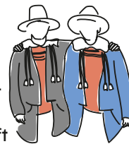
Wandgemälde am Haus „Greifen“ / Gasthaus Linde, Dögern

Während in Europa zahlreiche Grafschaften, Herzogtümer und Adelhäuser die Politik vorgaben, wählte in der Grafschaft Hauenstein jede Einung demokratisch aus ihren Reihen einen Einungsmeister. Wahlberechtigt waren alle verheirateten Männer innerhalb einer Einung. Diese wurden vom „Waldvogt“ – sozusagen der Vorgänger des heutigen Landrats – verpflichtet und in das Amt eingeführt. Zu erkennen waren sie an den blauen Jacken, während die normale Tracht schwarze Jacken hatte. Auch gegenwärtig gibt es noch ehrenamtliche Einungsmeister und die Tracht ist in vielen Musik- und Trachtenvereinen der Region heute noch sichtbar.